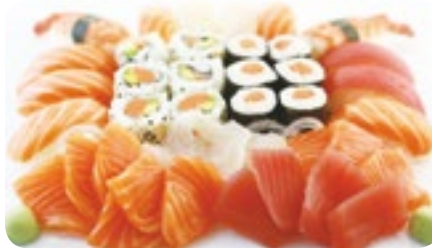
M14 49,90€ Menu 2 à 3 personnes 2 Soupes, 2 Salades, 2 Riz 12 Sushi assortis 6 California saumon avocat 6 Maki saumon 18 Sashimi assortis