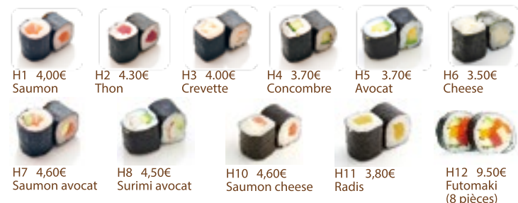
H1 4,00€ Saumon H2 4,30€ Thon H3 4,00€ Crevette H4 3,70€ Concombre H5 3,70€ Avocat H6 3,50€ Cheese H7 4,60€ Saumon avocat H8 4,50€ Surimi avocat H10 4,60€ Saumon cheese H11 3,80€ Radis H12 9,50€ Futomaki (8 pièces)