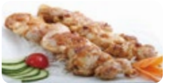
M27 9,50€ Soupe, Salade, Riz Poulet à la citronnelle