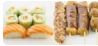
M20 16,00€ Soupe, Salade, Riz 2 Sushi saumon 6 Printemps saumon avocat 4 Brochettes (2 boeuf fromage, 1 poulet, 1 boulette de poulet)