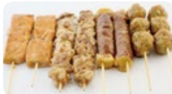
M8 16,50€ Soupe, Salade, Riz 8 Brochettes (2 saumon, 2 boeuf fromage, 2 poulet, 2 boulettes de poulet)