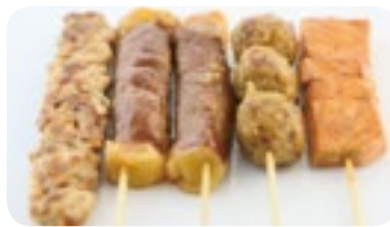
M12 11,30€ Soupe, Salade, Riz 5 Brochettes (2 boeuf fromage, 1 saumon, 1 poulet, 1 boulette de poulet)