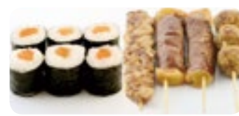
M16 13,00€ Soupe, Salade, Riz 6 Maki saumon 4 Brochettes (2 boeuf fromage, 1 poulet, 1 boulette de poulet)