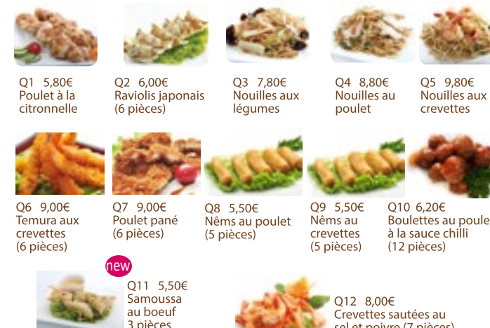
Q1 5,80€ Poulet à la citronnelle Q2 6,00€ Raviolis japonais (6 pièces) Q3 7,80€ Nouilles aux légumes Q4 8,80€ Nouilles au poulet Q5 9,80€ Nouilles aux crevettes Q6 9,00€ Tempura aux crevettes (6 pièces) Q7 9,00€ Poulet pané (6 pièces) Q8 5,50€ Nêms au poulet (5 pièces) Q9 5,50€ Nêms au crevettes (5 pièces) Q10 6,20€ Boulettes au poulet à la sauce chilli (12 pièces) Q11 5,50€ Samoussa au bœuf 3 pièces Q12 8,00€ Crevettes sautées au sel et poivre (7 pièces)