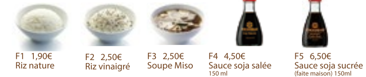
F1 1,90€ Riz nature F2 2,50€ Riz vinaigré F3 2,50€ Soupe Miso F4 4,50€ Sauce soja salée 150 ml F5 6,50€ Sauce soja sucrée (faite maison) 150ml