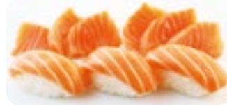
M2 10,00€ Soupe, Salade, Riz 3 Sushi saumon, 6 Sashimi saumon