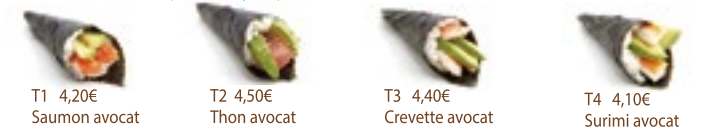
T1 4,20€ Saumon avocat T2 4,50€ Thon avocat T3 4,40€ Crevette avocat T4 4,10€ Surimi avocat