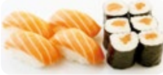
M1 9,50€ Soupe, Salade 4 Sushi saumon, 6 Maki saumon

Formules également disponibles le soir avec 1€ de supplément