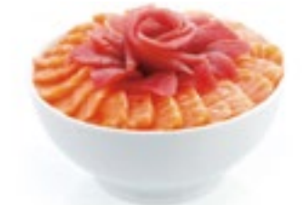
B1 13,50€ Chirashi saumon

Accompagné d'une soupe et d'une salade, Tranches de poisson cru sur un lit de riz vinaigré