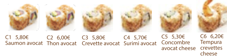
C1 5,80€ Saumon avocat C2 6,00€ Thon avocat C3 5,80€ Crevette avocat C4 5,70€ Surimi avocat C5 5,30€ Concombre avocat cheese C6 6,20€ Tempura crevettes cheese