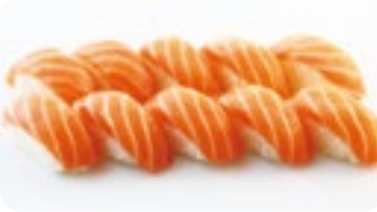
M5 14,80€ Soupe, Salade 10 Sushi saumon