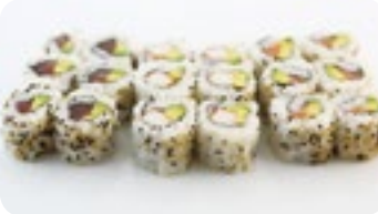
M10 15,00€ Soupe, Salade 6 California saumon avocat 6 California thon avocat 6 California surimi avocat