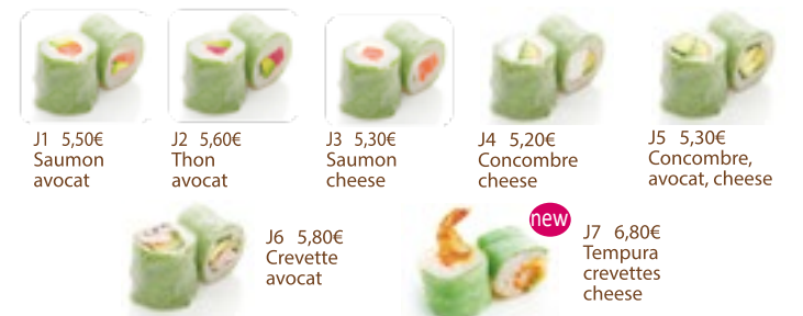
J1 5,50€ Saumon avocat J2 5,60€ Thon avocat J3 5,30€ Saumon cheese J4 5,20€ Concombre cheese J5 5,30€ Concombre, avocat, cheese J6 5,80€ Crevette avocat J7 6,80€ Tempura crevettes cheese