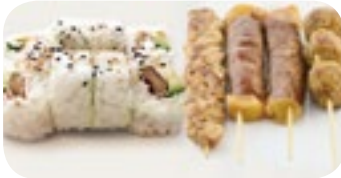
M24 16,80€ Soupe, Salade, Riz 8 Flocon boeuf fromage avocat cheese 4 Brochettes (2 boeuf fromage, 1 poulet, 1 boulette de poulet)