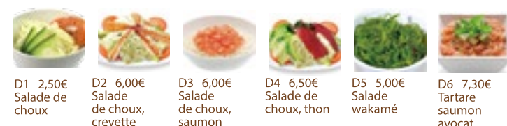
D1 2,50€ Salade de chou D2 6,00€ Salade de chou, crevette D3 6,00€ Salade de chou, saumon D4 6,50€ Salade de chou, thon D5 5,00€ Salade wakamé D6 7,30€ Tartare saumon avocat