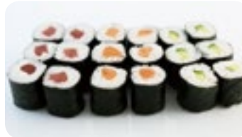
M11 13,00€ Soupe, Salade 6 Maki saumon 6 Maki thon 6 Maki concombre