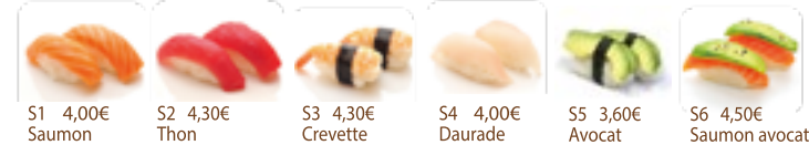
S1 4,00€ Saumon S2 4,30€ Thon S3 4,30€ Crevette S4 4,00€ Daurade S5 3,60€ Avocat S6 4,50€ Saumon avocat