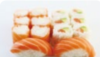
M21 15,50€ Soupe, Salade 2 Sushi saumon 6 Salmon roll fromage 6 Flocon saumon avocat