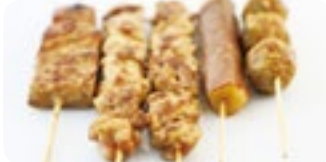
M4 10,00€ Soupe, Salade, Riz 5 Brochettes (1 boeuf fromage, 1 thon, 2 poulet, 1 boulette de poulet)