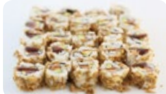
M19 16,40€ Soupe, Salade 8 Crispy saumon avocat 8 Crispy thon avocat 8 Crispy surimi avocat