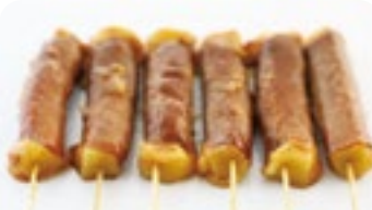
M18 12,50€ Soupe, Salade, Riz 6 Brochettes boeuf fromage