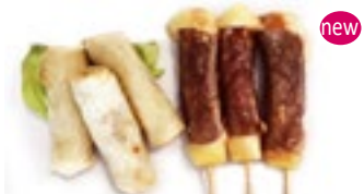
M29 10,00€ Soupe, Salade, Riz 3 nêms au poulet, 3 pièces boeuf fromage