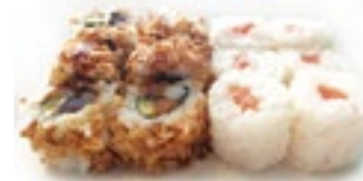
M28 10,00€ Soupe, Salade 6 Flocon saumon, 8 Crispy saumon avocat