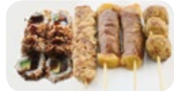
M23 14,80€ Soupe, Salade, Riz 8 Crispy saumon avocat 4 Brochettes (2 boeuf fromage, 1 poulet, 1 boulette de poulet)