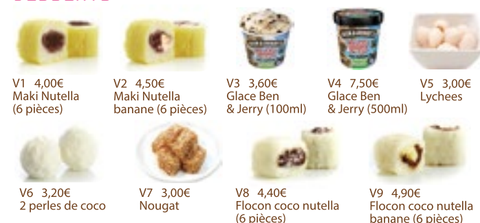
V1 4,00€ Maki Nutella (6 pièces) V2 4,50€ Maki Nutella banane (6 pièces) V3 3,60€ Glace Ben & Jerry (100ml) V4 7,50€ Glace Ben & Jerry (500ml) V5 3,00€ Lychees V6 3,20€ 2 perles de coco V7 3,00€ Nougat V8 4,40€ Flocon coco nutella (6 pièces) V9 4,90€ Flocon coco nutella banane (6 pièces)