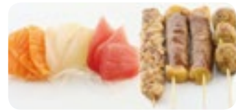
M17 15,80€ Soupe, Salade, Riz 9 Sushi assortis 4 Brochettes (2 boeuf fromage, 1 poulet, 1 boulette de poulet)