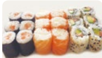
M22 16,00€ Soupe, Salade 6 Maki saumon 6 California saumon avocat 6 Salmon roll fromage