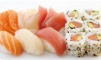
M9 16,30€ Soupe, Salade, Riz 3 Sushi assortis 6 California saumon avocat 9 Sashimi assortis