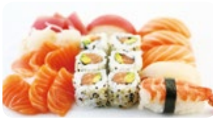
M13 26,90€ Menu 2 personnes 2 Soupes, 2 Salades, 2 Riz 6 Sushi assortis 6 California saumon avocat 12 Sashimi assortis