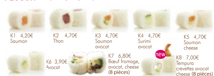
K1 4,20€ Saumon K2 4,70€ Thon K3 4,70€ Saumon avocat K4 4,70€ Surimi avocat K5 4,70€ Saumon cheese K6 3,90€ Avocat K7 6,80€ Bœuf fromage, avocat, cheese (8 pièces) K8 7,00€ Tempura crevettes avocat cheese (8 pièces)