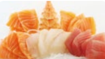
M7 15,90€ Soupe, Salade, Riz Assortiment de 18 tranches de poisson cru