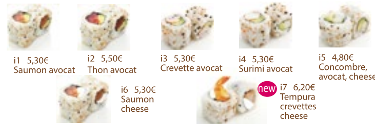
i1 5,30€ Saumon avocat i2 5,50€ Thon avocat i3 5,30€ Crevette avocat i4 5,30€ Surimi avocat i5 4,80€ Concombre, avocat, cheese i6 5,30€ Saumon cheese i7 6,20€ Tempura crevettes cheese