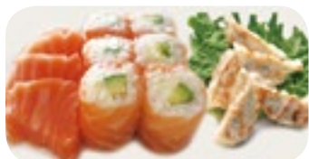
M25 16,50€ Soupe, Salade, Riz 4 Sashimi saumon 6 Salmon roll avocat fromage 5 Raviolis