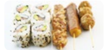
M3 10,00€ Soupe, Salade, Riz 6 California saumon avocat 3 Brochettes (poulet, boulettes de poulet, boeuf fromage)