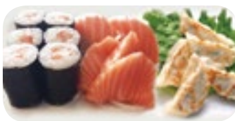
M26 17,50€ Soupe, Salade, Riz 2 Sushi saumon 3 Sashimi saumon 6 Maki saumon 5 Raviolis