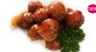
M30 9,50€ Soupe, Salade, Riz 12 boulettes au poulet à la sauce chilli