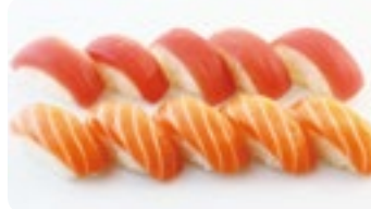
M6 16,80€ Soupe, Salade 5 Sushi saumon 5 Sushi thon